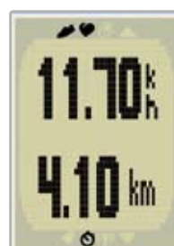
Indication Vitesse / Distance