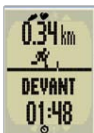
Fonction "Partenaire Virtuel"